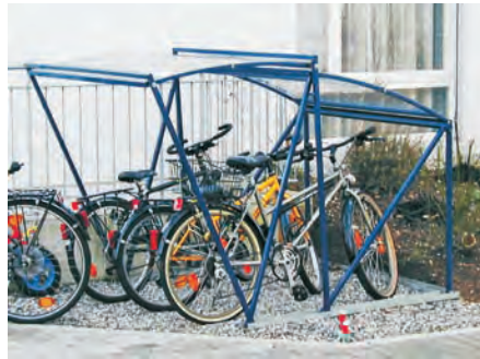
Problemlöser für Vorgärten

Darum, obwohl nur 1.43 m hoch, muss sich der Benutzer nicht bücken. Danach das Dach wieder nach vorne ziehen und die Fahrräder sind optimal geschützt. Da das Auf- und Zuklappen des Dachteils von Gasdruckfedern unterstützt wird, verursacht der Vorgang keinen Lärm.